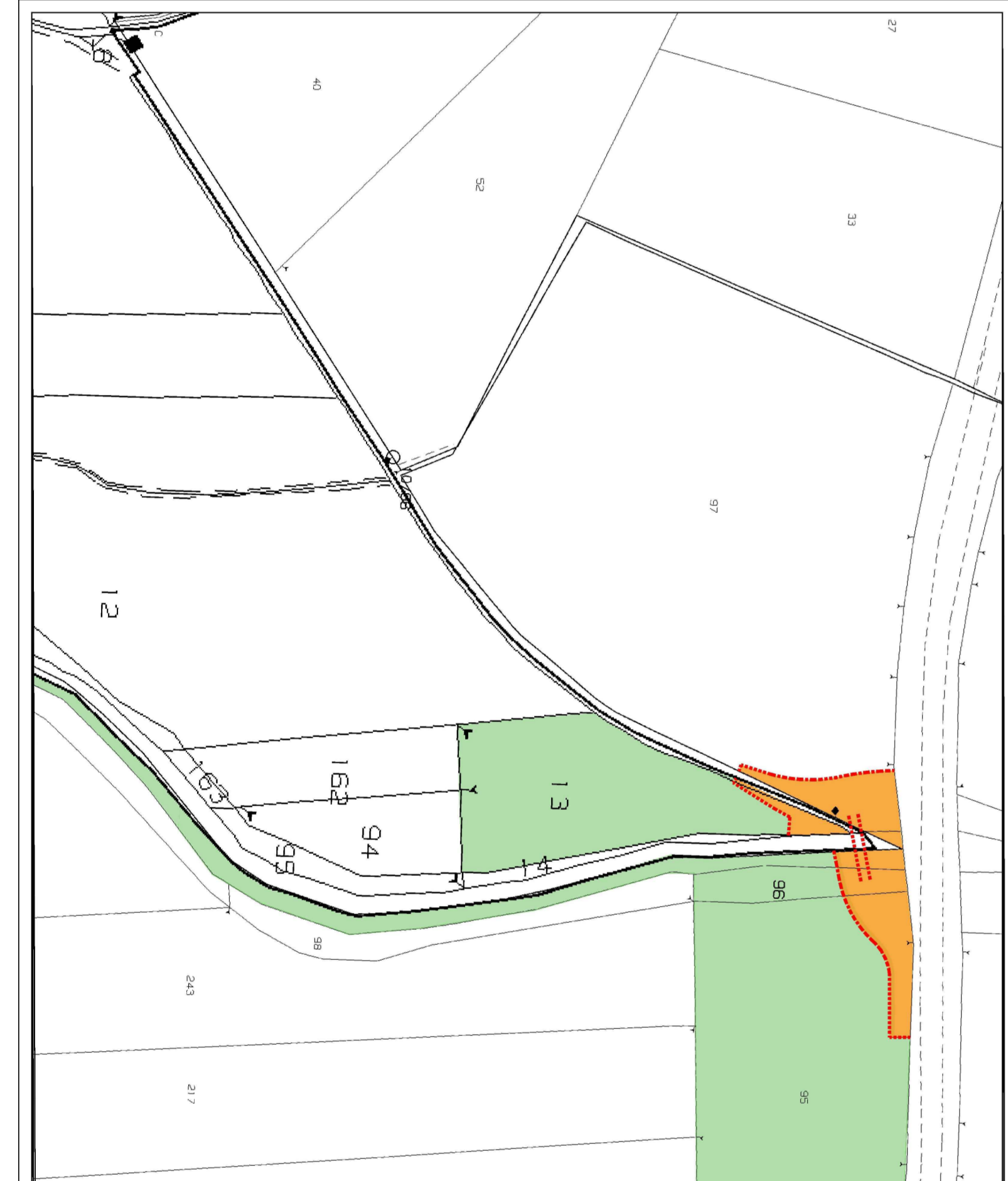
Estratto Piano Particelare Esproprio progetto Definitivo Passerella ciclopedonale sul Torrente Bronda