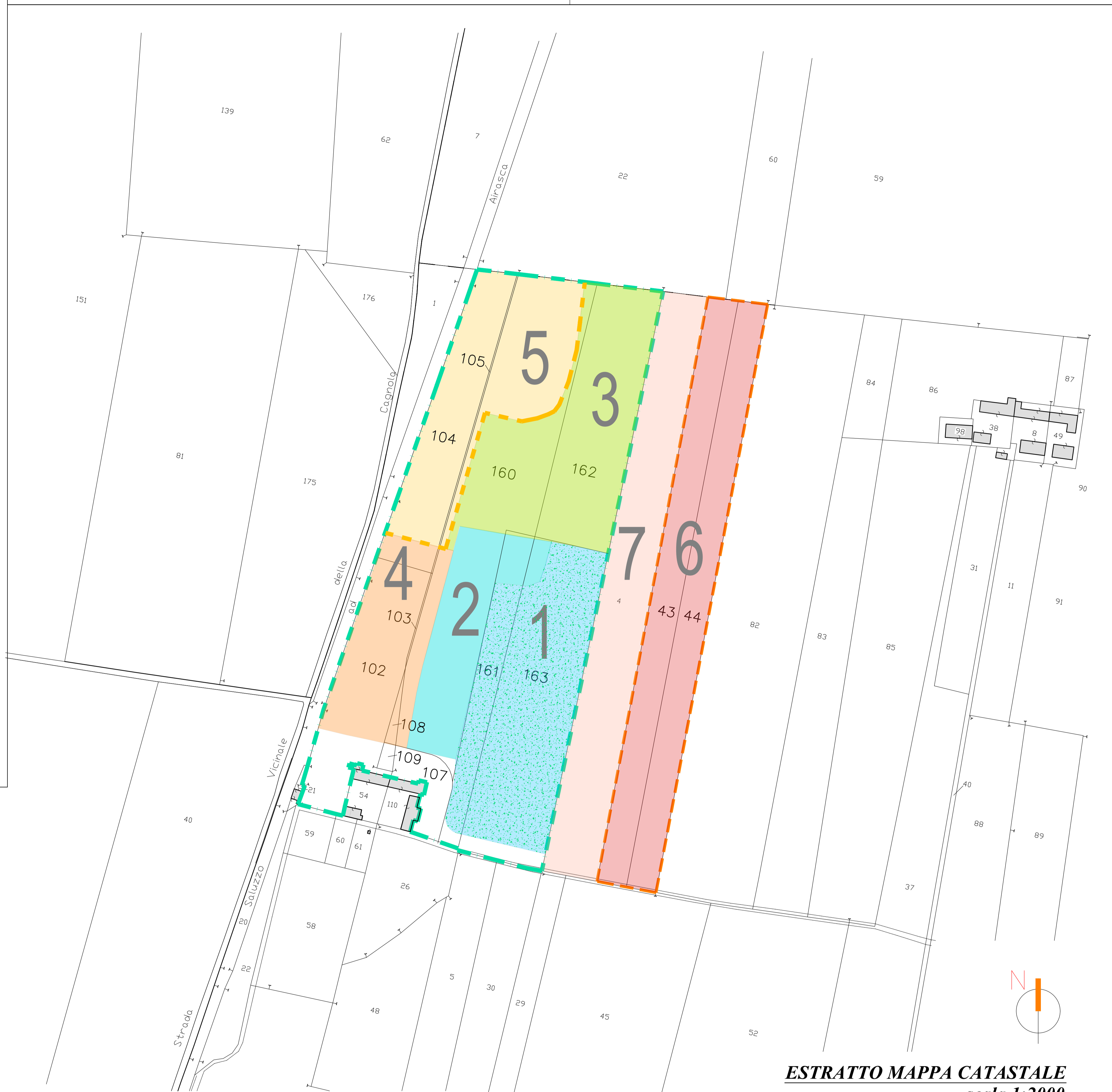
ESTRATTO MAPPA CATASTALE scala 1:2000

L.R. 40/1998 e s.m.i. L.R. n. 23/2016 e D.P.G.R. n.11/R 2017 N.T.C. 2018 e s.m.i. D. Lgs. 117/2008