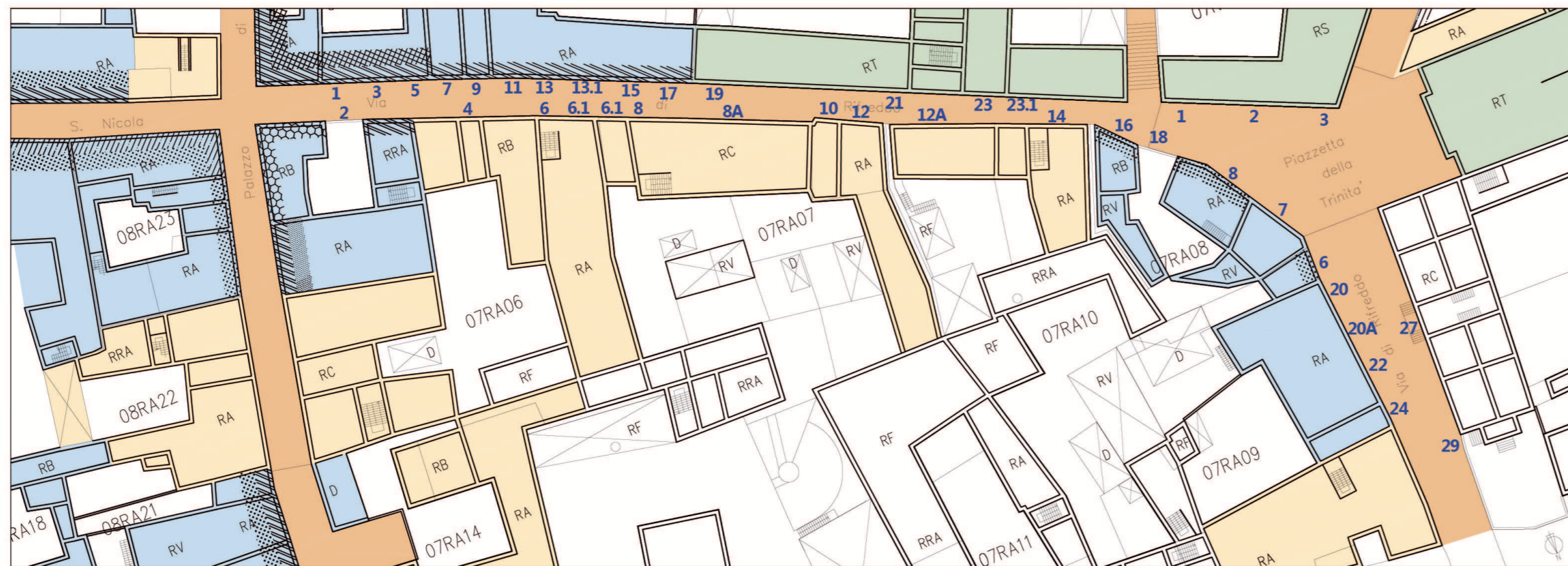
Scala 1 : 1000