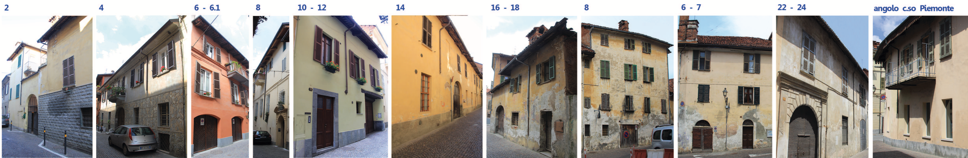
2 4 6 - 6.1 8 10 - 12 14 16 - 18 8 6 - 7 22 - 24 angolo c.so Piemonte