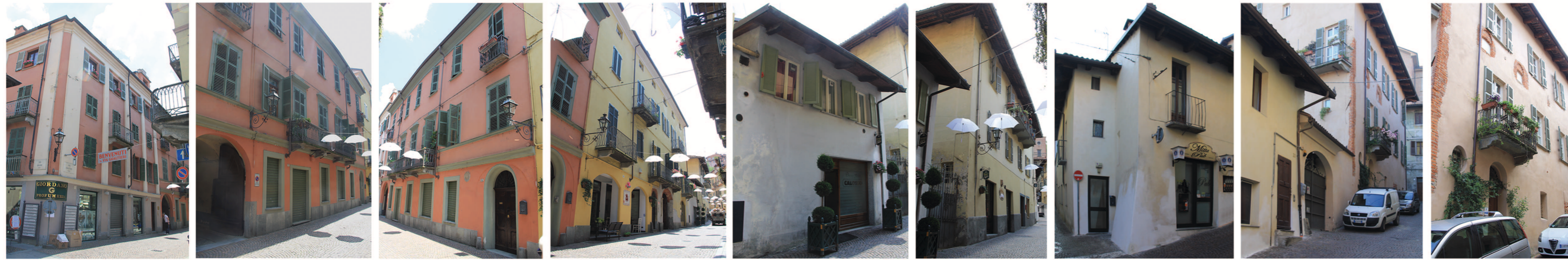
1 - 3