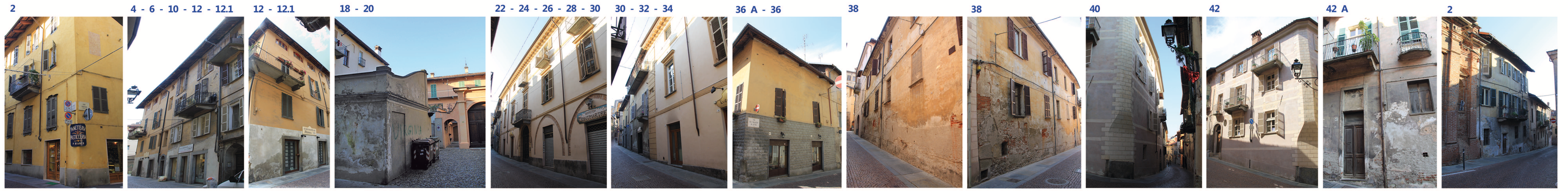
2 4 - 6 - 10 - 12 - 12.1 12 - 12.1 18 - 20 22 - 24 - 26 - 28 - 30 30 - 32 - 34 36 A - 36 38 38 40 42 42 A 2