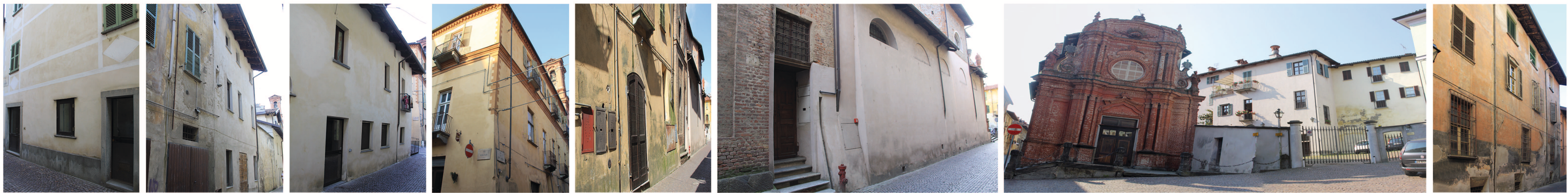
1 particolare 11.1 - 11.2 19 38 particolare 15 17 1 - 2 - 3 - 3.1 tra 25 e 27