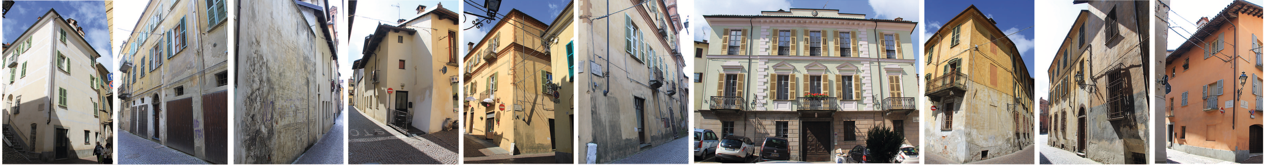
1 - 3 5 - 7 - 7.1 - 9 - 11 tra 11.2 e 13 13.1 38 (di via Gualtieri) 38.1 4 angolo via Adua 25 27