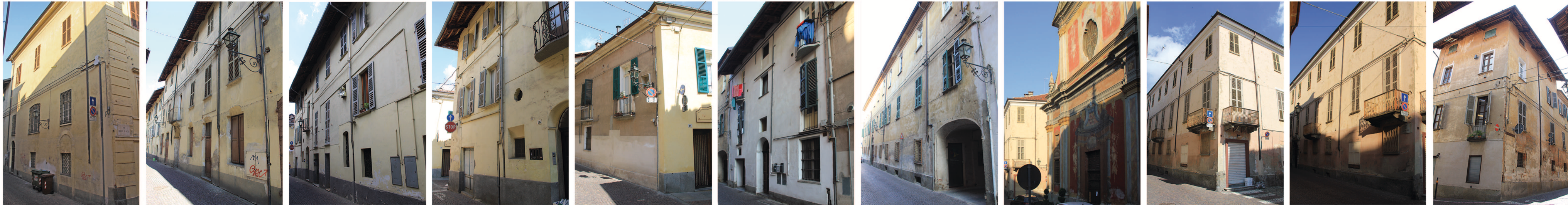
2 particolare 4 16 particolare 34 particolare 20 particolare 26 26 particolare 28 particolare 28 particolare 28 particolare