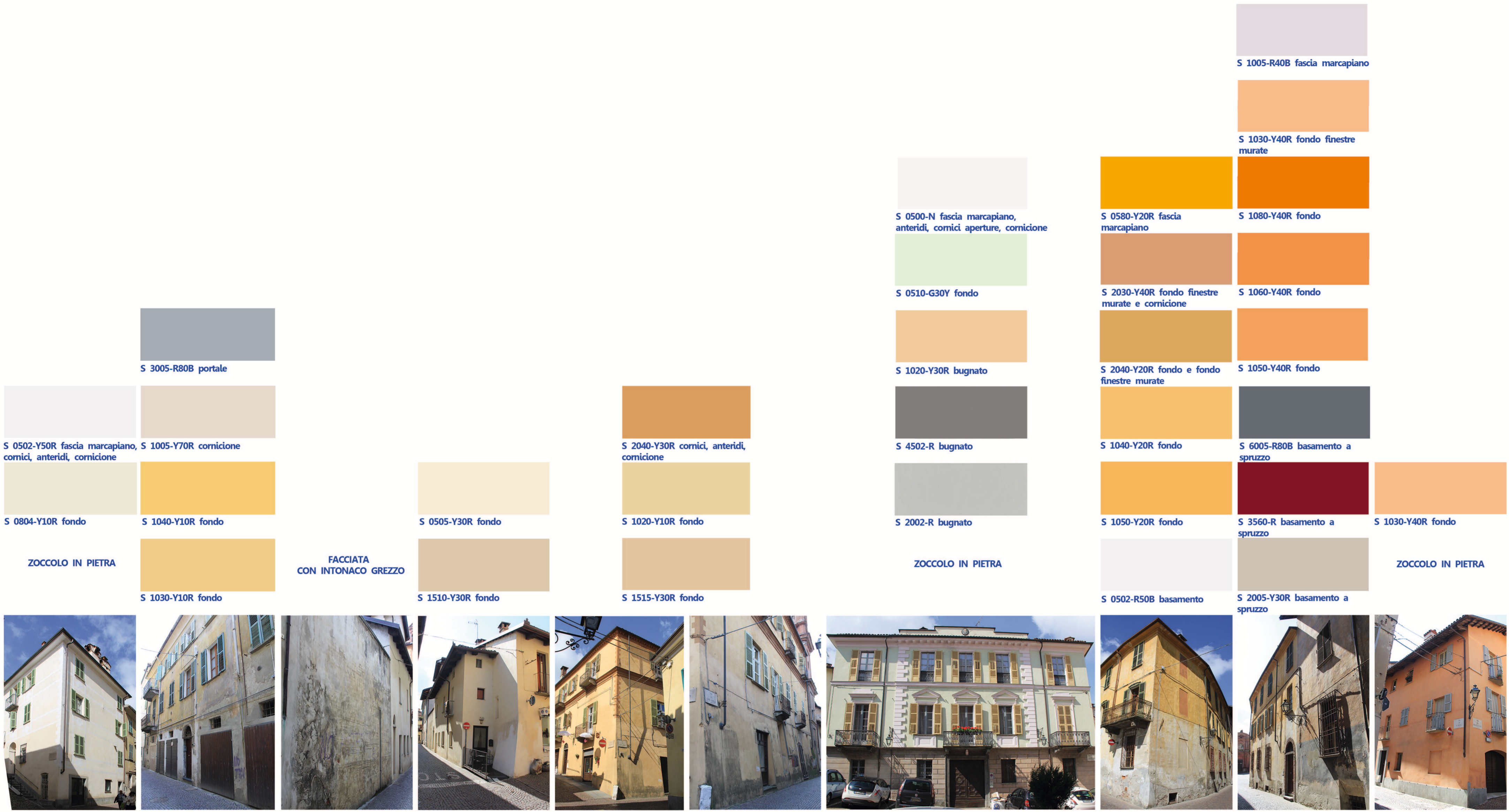
1 - 3 5 - 7 - 7.1 - 9 - 11 tra 11.2 e 13 13.1 - 13.2 38 (di via Gualtieri) 38.1 4 angolo via Adua tra 25 e 27 27