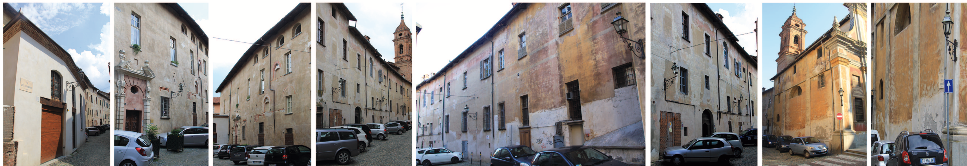
1 - 1.1 5 - 7 3 - 5 - 7 - 9 11 - 13 - 15 17 - 19 - 21 23 - 25 13 - 15 - 17 - 19 Chiesa San Nicola dettaglio chiesa San Nicola